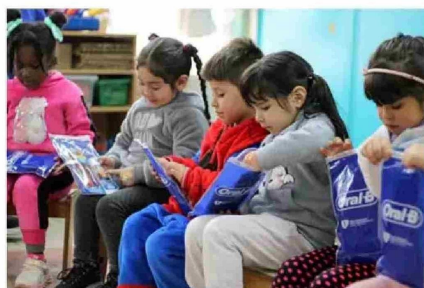
Gracias a la alianza entre Fundación Sonrisas y Oral-B, más de 40 mil adultos y niños accedieron a atenciones odontológicas gratuitas.