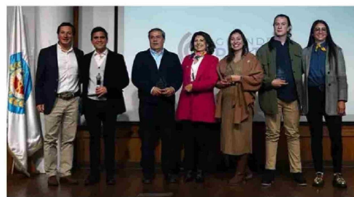
"Grandes Dentistas" es un premio que destaca a odontólogos en ámbitos como Docencia, Trayectoria, Talento Joven y Trabajo Social.

galardón es que la postulación es abierta, permitiendo a toda la comunidad nominar sus candidatos, quienes posteriormente son evaluados por un jurado compuesto por especialistas, expertos académicos y autoridades.