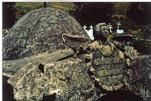
Imagen hecha por Vilches en el cementerio de Quincaví, en 1993. También ha fotografiado los camposantos de Chiloé y Punta Arenas.

Entre 1983 y 1984, el artista trabajó la serie “Ventanas”.