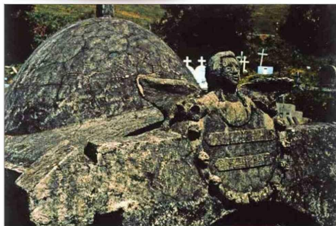
Imagen hecha por Vilches en el cementerio de Quincaví, en 1993. También ha fotografiado los camposantos de Chiloé y Punta Arenas.

Entre 1983 y 1984, el artista trabajó la serie “Ventanas”.