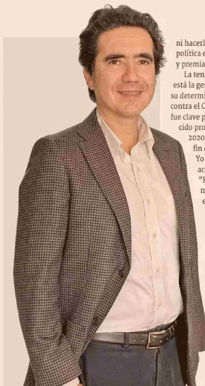
IGNACIO BRIONES EXMINISTRO DE HACIENDA (2019-2021) PRESIDENTE DE HORIZONTAL ACADÉMICO UAI

No era rencoroso. Enfrentó las peores descalificaciones y que algunos de los suyos le dieran la espalda, como en los retiros previsionales. Pero nunca lo vi guardar resentimiento