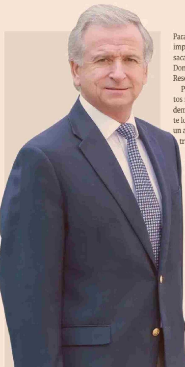
FELIPE LARRAÍN EXMINISTRO DE HACIENDA (2010-2014 Y 2018-2019). PROFESOR TITULAR ECONOMÍA UC DIRECTOR CLAPES UC.

A ello se suma la creación de un millón de empleos en momentos llenos de dificultades producto de la fuerte desviación de recursos destinados para la reconstrucción del país, tras el terremoto del 27 de febrero de 2010. El costo para la economía nacional del desastre natural fue cerca de US$ 30.000 millones, un 15% del PIB de la época.