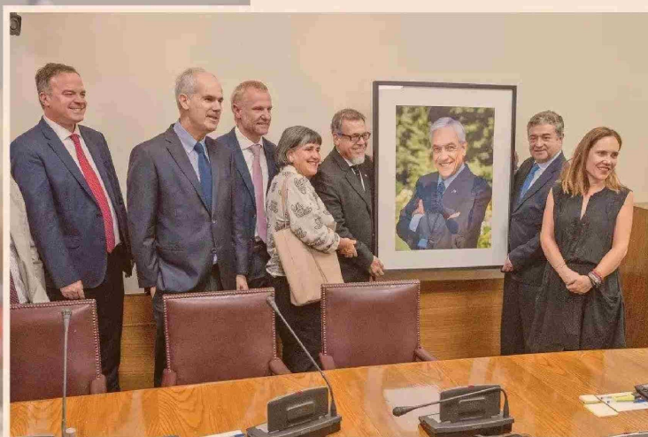
La sala de la comisión de Hacienda del Senado fue nombrada en enero "Presidente Sebastián Piñera Echenique", en reconocimiento a su trayectoria como senador de la República entre 1990 y 1998. Asistieron su hermana y una de las hijas del exmandatario.