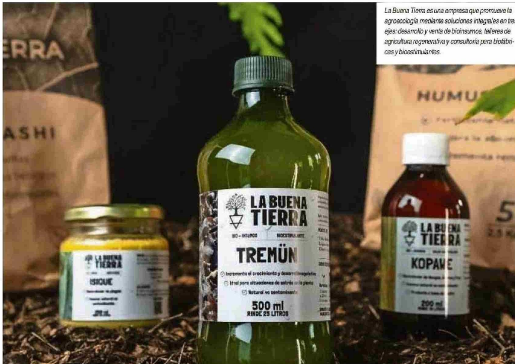
La Buena Tierra es una empresa que promueve la agroecología mediante soluciones integrales en tres ejes: desarrollo y venta de bioinsumos, talleres de agricultura regenerativa y consultoría para biofábricas y bioestimulantes.

Es una empresa de Valdivia que desarrolla mobiliario urbano y doméstico a partir de plástico reciclado, basándose en un enfoque sustentable y en economía circular al convertir residuos de diversos sectores industriales en muebles duraderos y de diseño atractivo, lo que la destaca como una alternativa sostenible a la madera convencional, ideal para jardines, terrazas y espacios públicos al generar productos que no necesitan mantenimiento, no se pudren con hongos ni insectos. Es un producto reciclado y también es reciclable.