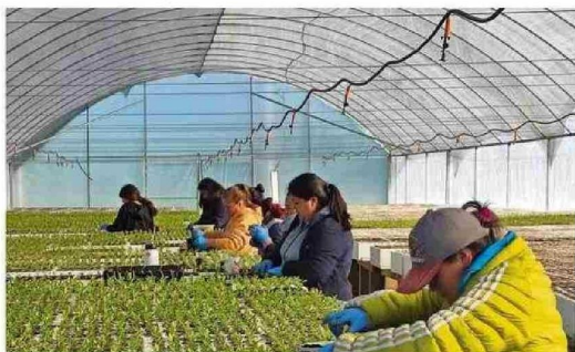
Con el respaldo de cinco fondos Corfo, Insular desarrolla su modelo de negocios con tecnología avanzada y un equipo multidisciplinario.