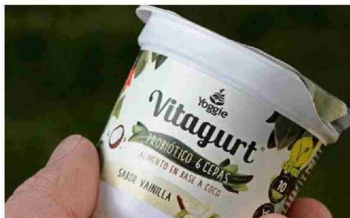
Vitagurt es una alternativa vegetal yogurt de la marca Yoggie que ofrece dos variedades: una proteica con lupino chileno y otra orgánica.

Innovación sostenible con impacto: cinco proyectos apoyados por IncubatecUFRO que están revolucionando la gestión de residuos, la regeneración ecológica, la agroecología, los alimentos sin alérgenos y el mobiliario urbano con economía circular.