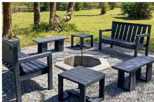
Eco Maderas es una empresa de Valdivia que desarrolla mobiliario urbano y doméstico a partir de plástico reciclado.