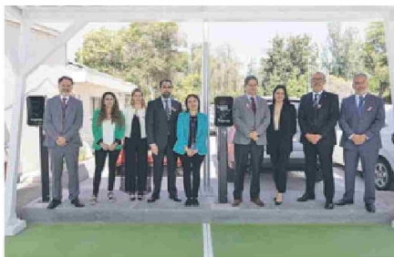
Rector de la UBO junto al subsecretario de Energía y académicos de la universidad en los tótems de recarga para autos eléctricos.

Cabe destacar que la UBO, reconocida con el sello de cuantificación del Programa HuellaChile del Ministerio del Medio Ambiente, refuerza su liderazgo en sostenibilidad. Desde 2022, la Universidad participa activamente en el II Acuerdo de Producción Limpia (APL) junto a otras instituciones de Educación Superior, logrando certificar los niveles 1 y 2 del Sello APL y avanzando hacia la meta de "Campus Sustentables" .