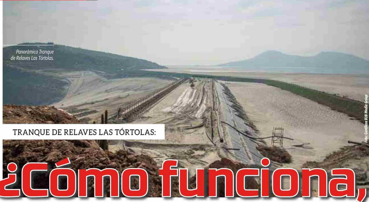
Panorámica Tranque de Relaves Las Tórtolas.