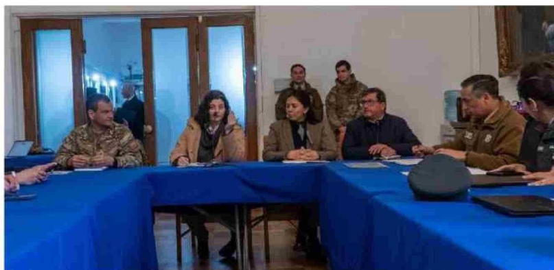
LA REUNIÓN SE REALIZÓ la mañana de este lunes en Concepción.