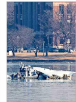
El peor accidente aéreo en dos décadas en EE.UU. deja 67 fallecidos y muchas interrogantes. | A 5

Misivas del genio de la física para su primera esposa provocan una encendida disputa judicial en Nueva York. | A 8