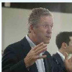
ALFREDO BRAVO FOTOS HÉCTOR VARGAS.

"Tenemos la flota de buses eléctricos más grande fuera de China y soñamos que en el futuro podamos sumar otros combustibles sostenibles, como el que usa este bus", puntualizó el ministro Muñoz.