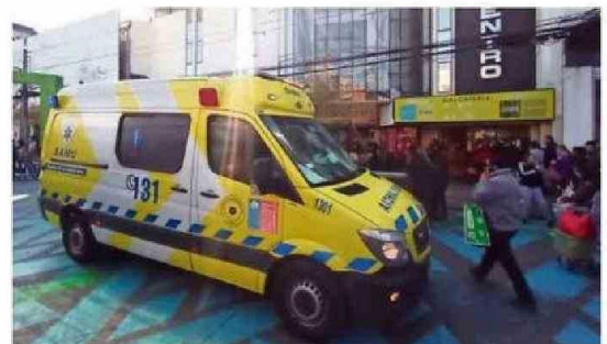
DECENAS DE PERSONAS SE AGOLPARON A MIRAR LO QUE OCURRÍA.

No es primera vez que un hecho de este tipo ocurre en el “Caracol”. El 27 de febrero de 2018 ocurrió lo mismo. Una mujer (48) murió instantáneamente. Además, está el caso de una joven (21) que se lanzó desde el tercer piso del Mall Portal Temuco, el 17 de mayo de este año. ☹