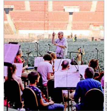
UNIVERSIDAD DE CHILE