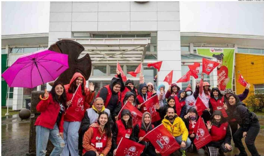
ESTE 2024 EL INSTITUTO TELETÓN DE VALDIVIA CUMPLE OCHO AÑOS, DESDE SU FUNDACIÓN.

llevó a cabo el Instituto Teletón de Valdivia en 2023. Por otra parte, otorgó, fabricó o reparó 846 órtesis y 28 prótesis destinadas a los pacientes.