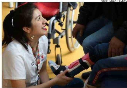
DESTACARON TRABAJO EN MATERIA DE REHABILITACIÓN.

Por otra parte, realizaron la Jornada Regional de Educación Inclusiva, en la cual participaron representantes de la comunidad educativa de la región de Los Ríos.