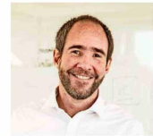
» Juan Andrés Errázuriz, CEO Enaex «

Enaex, con casi 40 años en Mejillones y más de 100 en Calama, ha apoyado a organizaciones comunitarias. Su estrategia fortalece el vínculo con las comunidades mediante iniciativas educativas y ambientales. Destacan el Programa Educativo en sus plantas, así como "Puertas Abiertas", que promueve la transparencia y confianza local.