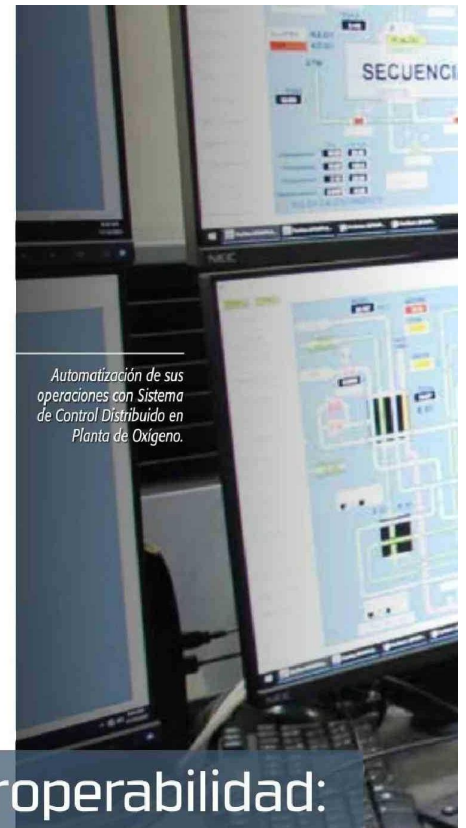
Automatización de sus operaciones con Sistema de Control Distribuido en Planta de Oxígeno.