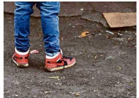
HAY 74 MENORES DE EDAD, DE ELLOS 8 SON LACTANTES.

Cabe señalar que la cifra de menores de edad tie-