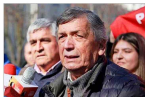
El presidente del PC, Lautaro Carmona, cuya comisión política solicitó un "Gran acuerdo nacional" para combatir el crimen organizado.