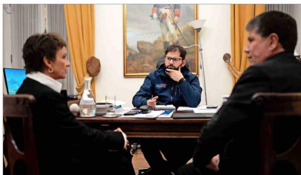
El Presidente Boric llegó desde Paraguay ayer en la tarde y se trasladó a La Moneda a reunirse con la ministra del Interior, Carolina Tohá y el subsecretario Manuel Monsalve, en el palacio de La Moneda, para ponerse al tanto de las acciones que tomará el Gobierno.

Dentro de las propuestas que más llamaron la atención estuvo la de la comisión política del Partido Comunista, la que pidió "un gran acuerdo nacional" con el