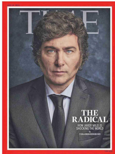
Portada de la edición de junio de la revista Time, que desde ayer está disponible en la web.

Dato. El ultraderechista presidente argentino presentó una cuestionada obra sobre economía.