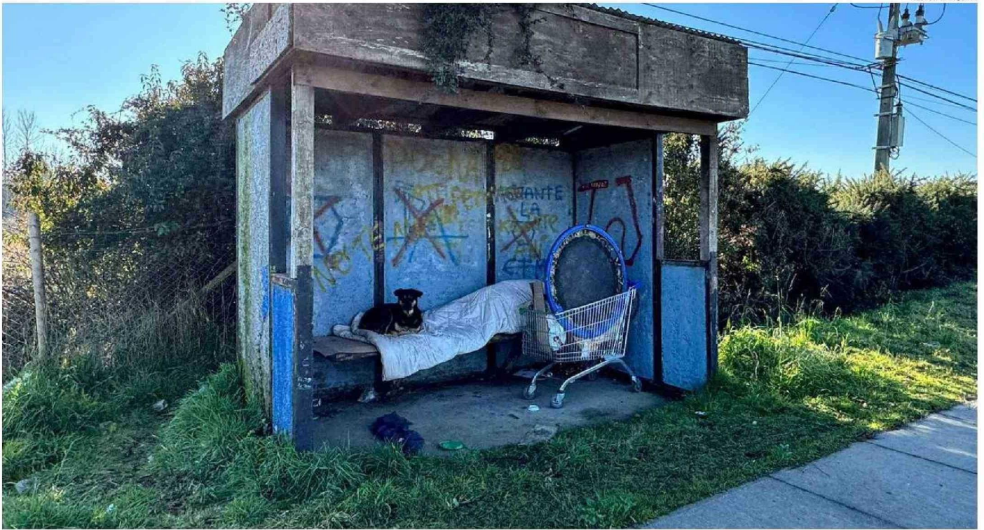
ESTA IMAGEN FUE CAPTADA AYER EN LA MAÑANA CUANDO LA TEMPERATURA ERA DE UN GRADO BAJO CERO. ESTA PERSONA EN SITUACIÓN DE CALLE ACOMPAÑADA DE SU MASCOTA, PERNOCTA EN ESTA PARADA EN LA RUTA 7.