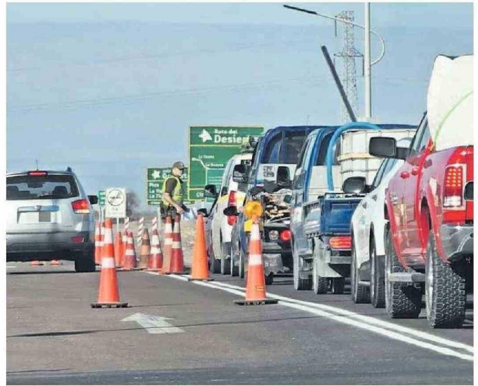
ASÍ LUCIÓ AYER LA CARRETERA EN DIRECCIÓN A LA TIRANA.