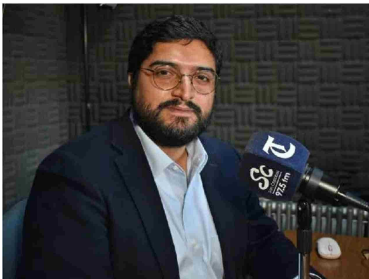
Seremi de Hacienda, Sebastián Rivera.

En paralelo, se anunciaron iniciativas para fomentar el desarrollo agrícola mediante financiamiento a pequeños productores y la promoción de tecnología sustentable en el sector.