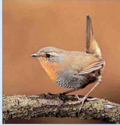
En la Región de los Lagos pudo escuchar al chucaco, cuyo canto, dice, es único y emblemático de la Patagonia.

"He ido a museos de historia natural y he podido tocar a las aves taxidermizadas de las colecciones de ornitología y he podido tocarlas también en la naturaleza. Pero no todas las personas ciegas tienen esa chance y eso me ha impulsado a realizar actividades inclusivas. Yo creo que la naturaleza es un derecho humano, he venido trabajando fuertemente en eso: de que las personas ciegas podamos tener un poco más