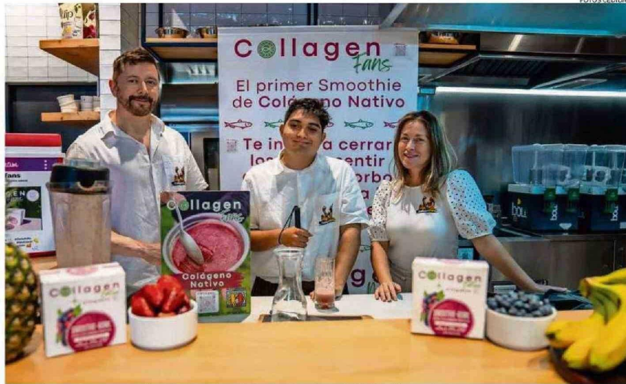
El pasado mes de mayo el producto fue lanzado en ferias de alimentos en la Región Metropolitana.