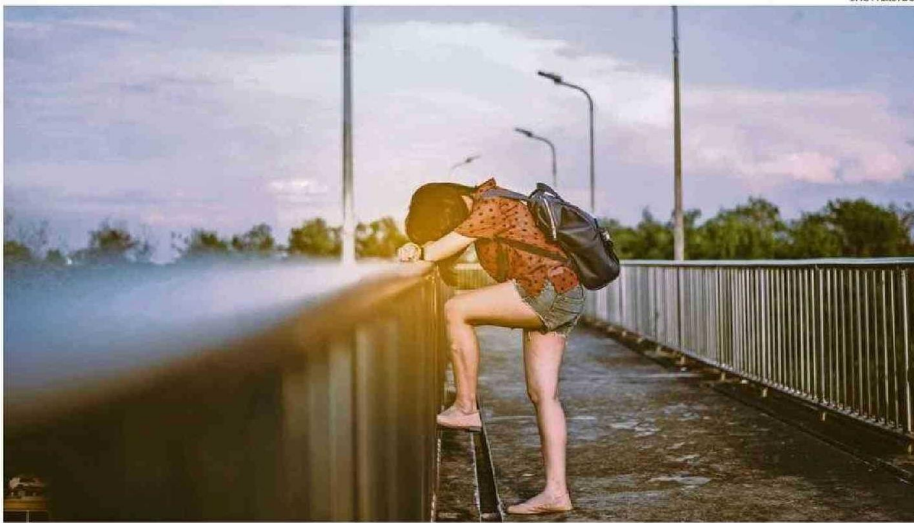
LA ORGANIZACIÓN MUNDIAL DE LA SALUD (OMS) ASEGURA QUE EL SUICIDIO ES UN PROBLEMA DE SALUD PÚBLICA A NIVEL GLOBAL.