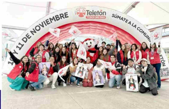
Esta es solo una de diversas intervenciones que realiza el voluntariado de campaña.