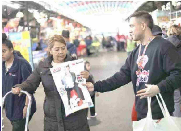
La idea es vestir las calles de la citada campaña y motivar a la ciudadanía a ser parte de dicha cruzada solidaria.