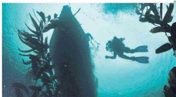
HOMBRE BUCEANDO DURANTE UNA EXPEDICIÓN EN EL CABO FROWARD, RESERVA NACIONAL KAWÉSQAR.

sistemas marinos en la región patagónica, que hasta hoy permanecen casi inexplorados.