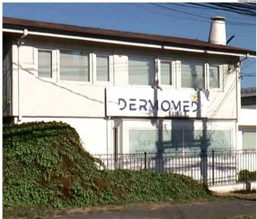
LA CLÍNICA SE UBICA EN CALLE FREIRE, AL LLEGAR A MANUEL RODRÍGUEZ, EL PERSONAL ADMINISTRATIVO Y OTROS PROFESIONALES RENUNCIARON.

La situación con la clínica y su representante se agudizó a poco días de haber iniciado el 2025, cuando un número importante de pacientes llegó a las instalaciones del Centro Médico y exigió la devolución de sus dineros. Esto generó que las propias funcionarias