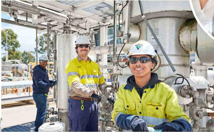
Estudiantes realizando su práctica en procesos de gas y aceite en el Centro Australiano para la Energía y Entrenamiento de Procesos.

En la próxima década, se estima que más de nueve de cada diez nuevos empleos que se generen en Australia requerirán alguna cualificación