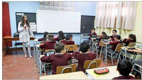
La educación media es la más afectada por el déficit, pero colegios de distintas regiones han alertado sobre falta de profesionales en Enseñanza Básica.

“Existen zonas del norte y sur donde, en colegios públicos, faltan profesores de educación básica. Esas labores las realizan otros profesionales que no necesariamente cuentan con la preparación disciplinar y pedagógica”.