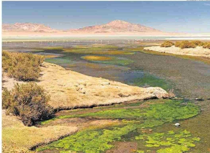
EL SALAR DE ASCOTÁN, UBICADO EN OLLAGÜE, ES UNO DE LAS ZONAS DONDE SE EXPLORARÍA Y EXPLOTARÍA LITIO.