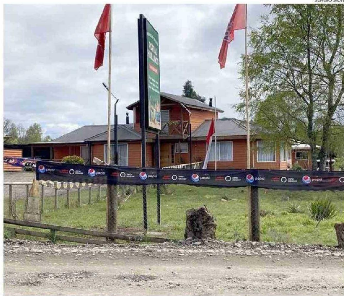
LA VIVIENDA DONDE OCURRIÓ EL ASALTO SE UBICA A MENOS DE 20 METROS DE LA RUTA U-400 AL MAR.

El comerciante no dudó en enfrentarse a uno de los maleantes. Se abalanzó contra el ladrón y logró neutralizarlo. Lo