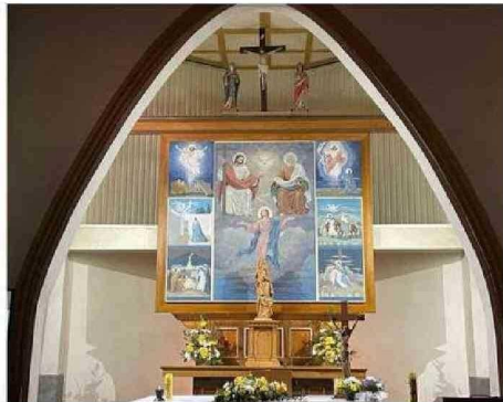
TAMBIÉN SE REPARARÁ EL MURAL DE LA NAVE CENTRAL.

MONUMENTO NACIONAL. Equipo de profesionales de la Pontificia Universidad Católica comienzan las obras de reparación de la estructura y mural del templo.