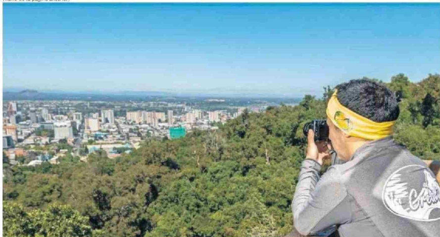
EL MONUMENTO NATURAL CERRO ÑIELOL OFRECE MIRADORES EN MEDIO DE LA VEGETACIÓN NATIVA DEL RECINTO.