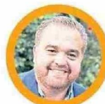
Sergio Giacaman, Gobernador Regional del Biobío

El Biobío vivió este martes el inicio de un nuevo ciclo con el primer día oficial de Sergio Giacaman en su cargo como Gobernador Regional. Una primera jornada cargada de actividades, papeleo administrativo y un corto espacio para socializar con la gente de Concepción.