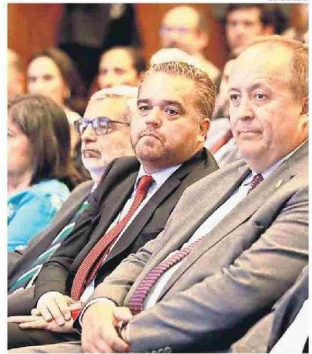
EL GOBERNADOR EN SU PRIMERA ACTIVIDAD COMO AUTORIDAD.

Cristian Aguayo Venegas cronica@estrellaconce.cl