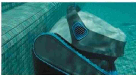
Un robot que limpia su piscina. Su valor en el mercado puede ir desde los $400 mil a $1.500.000.

pertos analizaron las implicancias de esta transformación y advierten sobre los desafíos que plantea.