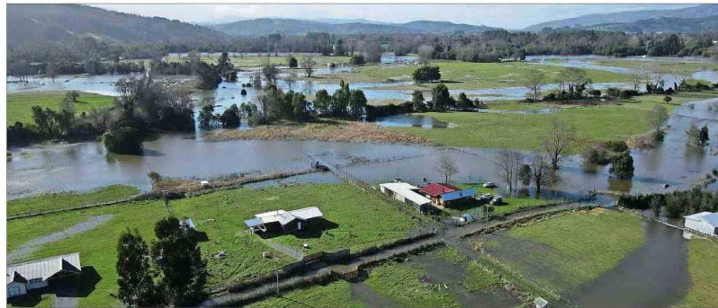
APOYO EN RESCATE. — Personal de emergencia ayudó en la evacuación de unas 50 familias del sector de Imulfudi, en la comuna de Lanco, aunque varias rechazaron dejar sus hogares.

Con todo, precisó Alvia, 24 personas debieron evacuar sus hogares "por las