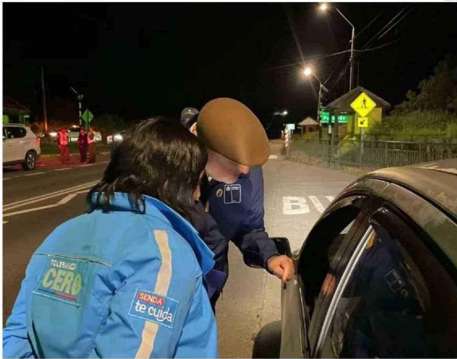
LOS CONTROLES PARA EVITAR LA CONDUCCIÓN DE VEHÍCULOS BAJO LOS EFECTOS DEL ALCOHOL Y LAS DROGAS SE EJERCEN EN FORMA FRECUENTE.

autorizados para expender bebidas alcohólicas existen en la comuna de Futaleufú, pero deberían haber 5.