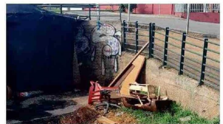
DEJAN BASURA QUE GENERA OTROS PROBLEMAS

Y el problema no solo son las incivildades que generan los habitantes de los rucos. “Dejan mucha basura, colchones, frazadas, ropas, cobertores y como están en el colector de aguas lluvias, todo eso corrió y la tapa del alcantarillado de la esquina de Manuel Montt con Luis Gon-