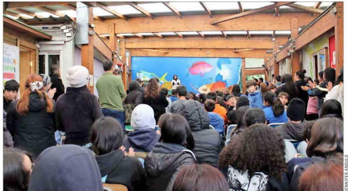
PROFESIONALES. — En el establecimiento, cuya estructura tendrá 1.800 metros cuadrados, se desempeñarán 36 docentes y 20 auxiliares de la educación.

El Mineduc recuerda que a principios de este año, en el marco del desarrollo del Programa Arquitectónico de Recintos y a partir del trabajo conjunto entre el Servicio Local de Educación Pública (SLEP) de Valparaíso, la Seremi de Educación de Valparaíso y la comunidad educativa local, se acordó con el Ministerio de Desarrollo