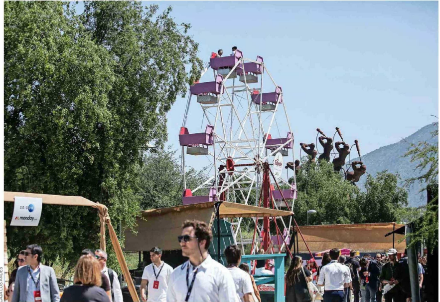
En www.emprendetumente.org está el programa completo del evento.

Y la tercera opción es el Elevator Pitch , una actividad de conexión en la que, en la réplica de un ascensor, inversionistas escuchan los pitch de representantes de startups en 5 minutos.