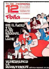
Afiche de la muestra en el CCLM.