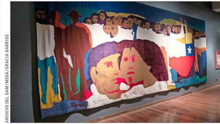
"Multitud III", de Gracia Barrios, se exhibe junto con una obra de gran formato elaborada por las Bordadoras de Isla Negra.