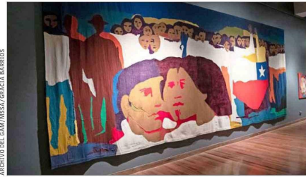
"Multitud III", de Gracia Barrios, se exhibe junto con una obra de gran formato elaborada por las Bordadoras de Isla Negra.

A realizarse el 12 de septiembre en el GAM, se trata de uno de los eventos con mayor presencia internacional: entre sus invitados se cuentan el novelista cubano Leonardo Padura; el ensayista estadounidense que ha abordado los temas de la memoria histórica, David Rieff; el crítico literario mexicano Christopher