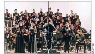
La Orquesta y Coro de la Memoria se reúne otra vez en la Usach para el concierto de la víspera.