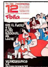
Afiche de la muestra en el CCLM.