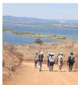
La zona es un lugar ideal para amantes de la naturaleza.

“ Emplazamos al Estado de Chile a que se haga cargo y adquiera este espacio (Fundo Ramuncho) para convertirlo en un área efectivamente protegida, en que podremos desarrollar proyectos de ecoturismo de educación medioambiental y de esparcimiento para toda nuestra comunidad.”