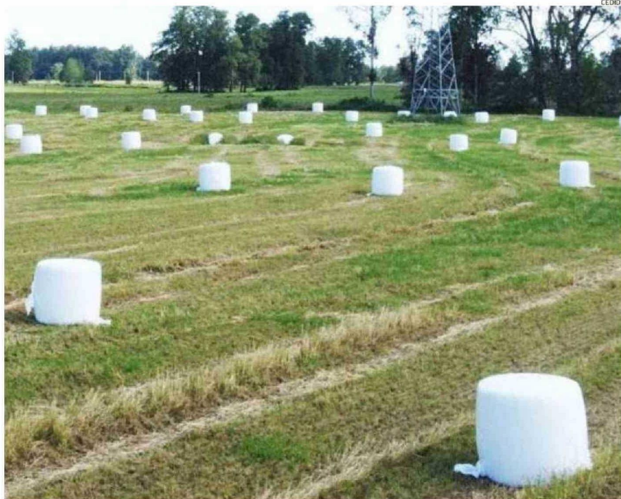
ESTA TEMPORADA LAS PRADERAS HAN TENIDO UN BUEN RENDIMIENTO, POR LO QUE SE VAN A ENVASAR MUCHOS BOLOS.

“Es un tremendo alivio, porque antes incluso terminaba quemándolos, porque eran