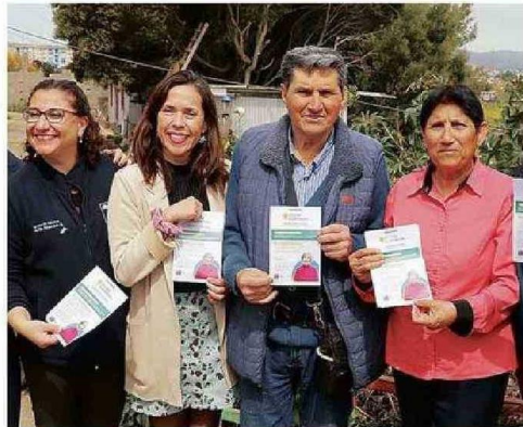
EL PROCESO SE MANTENDRÁ HASTA EL 6 DE NOVIEMBRE.