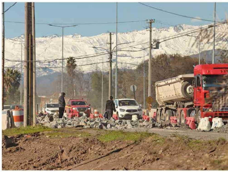
El retraso en la construcción de la carretera El Cobre afecta a vecinos y comerciantes de la zona.

afectados por los trabajos. A un costado de la vía sur se aprecia una importante área comercial, como: bancos, farmacias, clínicas (Isamédica y FUSAT) y supermer-