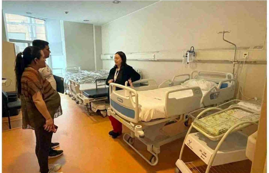
EN EL HOSPITAL DE PUERTO MONTT SE REALIZAN RECORRIDOS PREVIOS EN LAS SALAS DE MATERNIDAD, LO QUE SE REPLICA EN OTROS RECINTOS.

Otra opción es viajar por tierra hasta la ciudad Argentina de Esquel para tener a sus hijos, lo que revierte mayor complicación, porque el menor queda registrado como ciudadano argentino. Debe es-