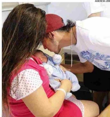
DAR A LUZ ES UN PROCESO DISPAR EN LA REGIÓN DE LOS LAGOS.