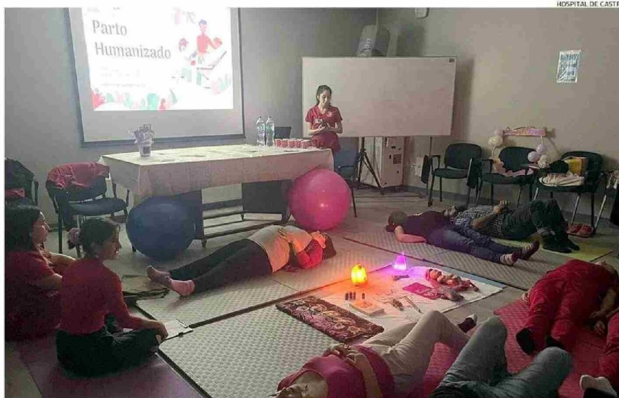
EN EL HOSPITAL DE CASTRO, AL IGUAL QUE EN EL RESTO DE LA RED PÚBLICA, SE HACEN SESIONES DE ORIENTACIÓN A LAS MUJERES EMBARAZADAS.

Una realidad muy distinta a la que viven las mujeres de zonas rurales, y peor aún si viven