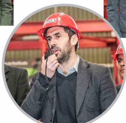
Nicolás Grau, ministro de Economía, Fomento y Turismo, durante la inauguración de la planta.