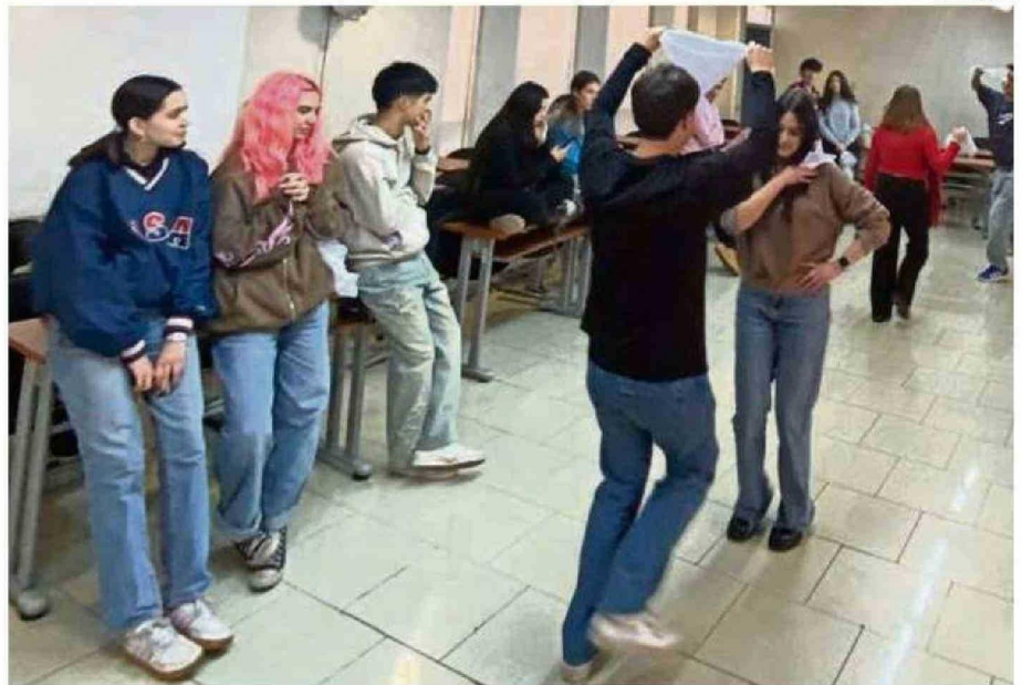
CLASE CUECA CHILENA, FACULTAD DERECHO UNIVERSIDAD DE CHILE.

CURSO-TALLER CUECA CHILENA, SEGUNDO SEMESTRE 2024