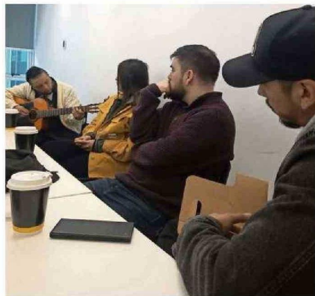
LAUTARO EN CANTO POR MANO CON ESTUDIANTES.

Sin embargo, quisimos profundizar los esfuerzos. Le propusimos al equipo curricular de la Facultad de Derecho de la Universidad de Chile ofrecer una alternativa que aportara a enriquecer los contenidos del estudiantado. La acogida fue reveladora, por pri-