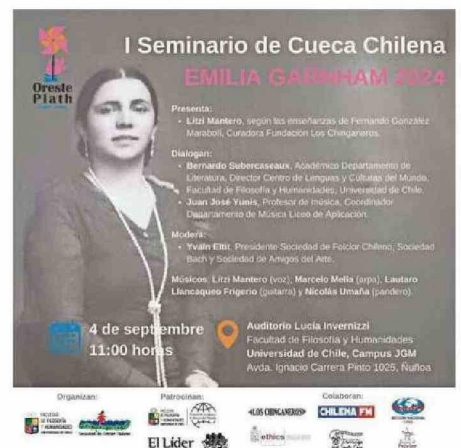
I SEMINARIO DE CUECA CHILENA EMILIA GARNHAM 2024.