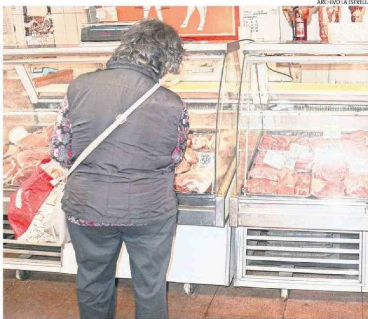
LAS ALZAS DE ALIMENTOS, SERVICIOS Y OTROS IMPACTAN EN EL PRESUPUESTO DE LAS FAMILIAS.

La especialista subrayó que "en Biobío, los hogares enfrentan un fuerte impacto en su presupuesto mensual por el alza en alimentos, vivienda y transporte. Los precios de alimentos básicos como carnes y frutas han registrado significativos aumentos, mientras que las tarifas eléctricas, descon-