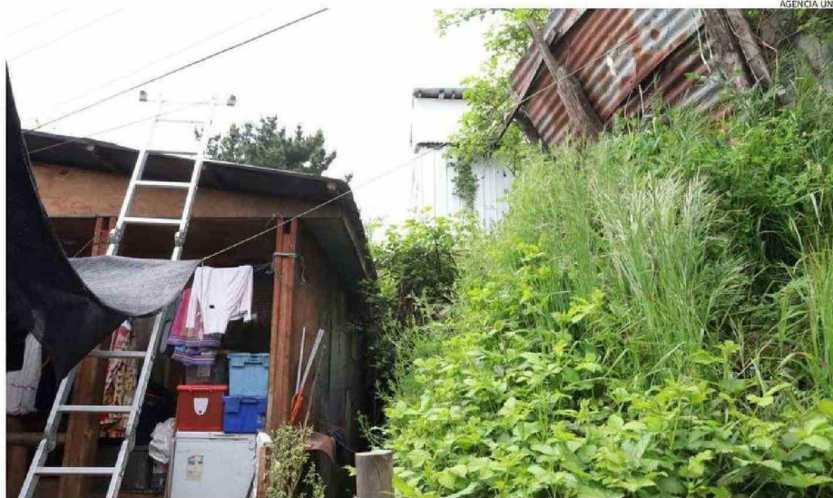
UNA BUENA PARTE DE LAS CASAS DE LA CALLE SANTA MARÍA, QUE ORILLAN EL RÍO DAMAS, ESTÁN BAJO LA COTA DEL RÍO. VARIAS TIENEN POZOS NEGROS.

“Nosotros tenemos considerada esta realidad dentro de