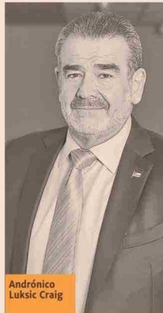
Andrónico Luksic Craig