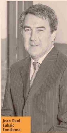
Jean Paul Luksic Fontbona